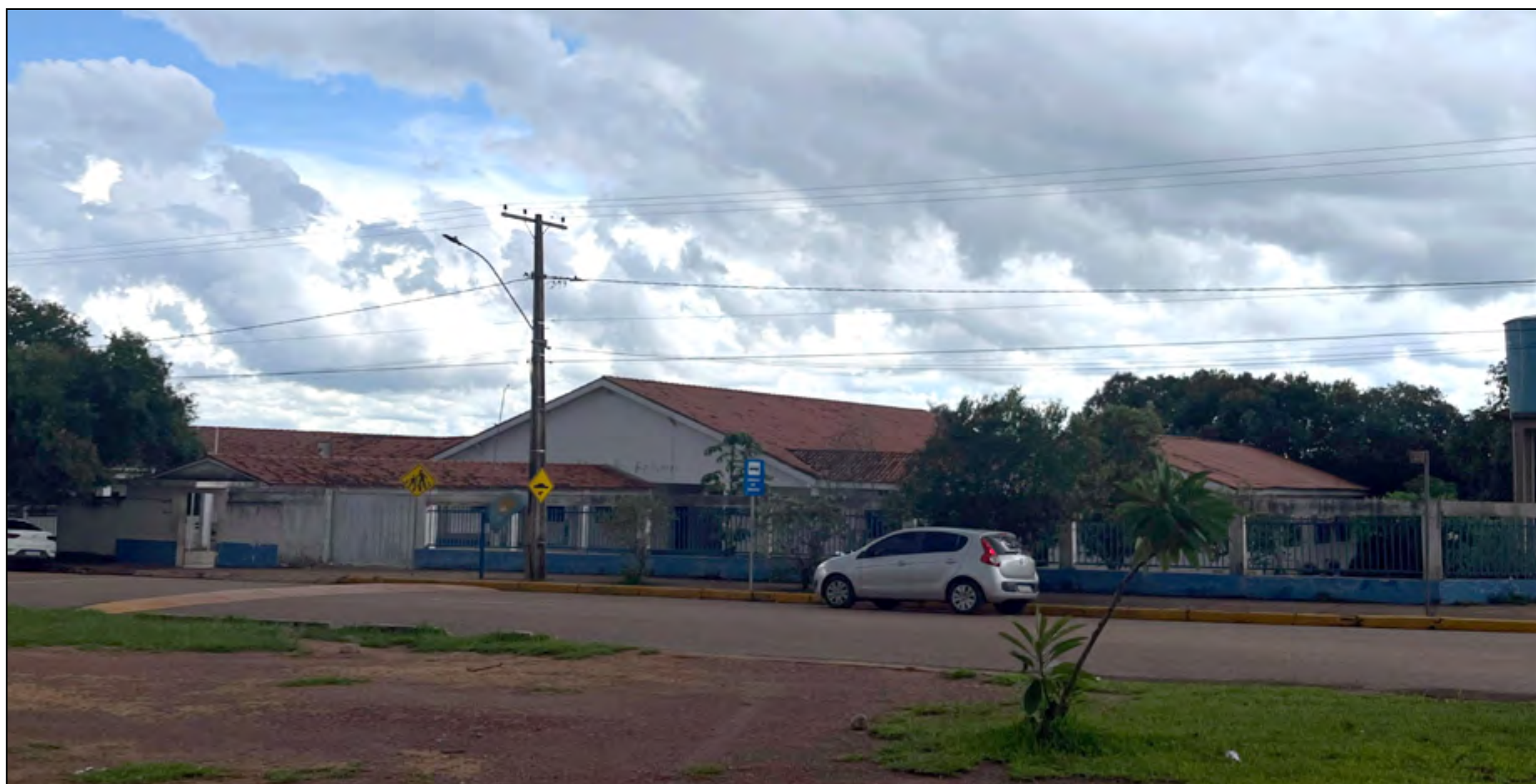
CÍVICO MILITAR: A Escola Helena Esteves, no Jardim Nova Barra Norte, hoje é referência em educação infantil.

Outro setor privilegiado foi o programa de alimentação de aluno, a melhoria substancial da merenda escolar, o que é fundamental para o bom aprendizado. Em resumo, essas ações transformaram a Educação em Barra do Garças, tornando a cidade mais inclusiva e apta para preparar seus jovens para os desafios do futuro.